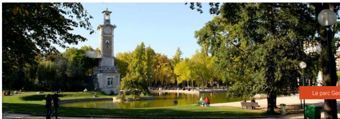
Le parc Georges Brassens