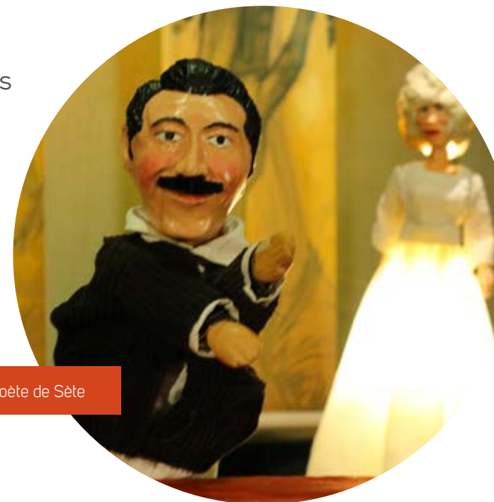
Le poète de Sète

Le poète de Sète. L'attention portée à la scénographie, aux jeux de lumières, à la diversité des décors et la présence d'un musicien marionnettiste permet de renouveler le style.