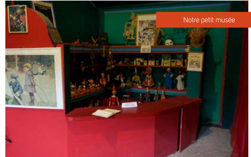
Notre petit musée