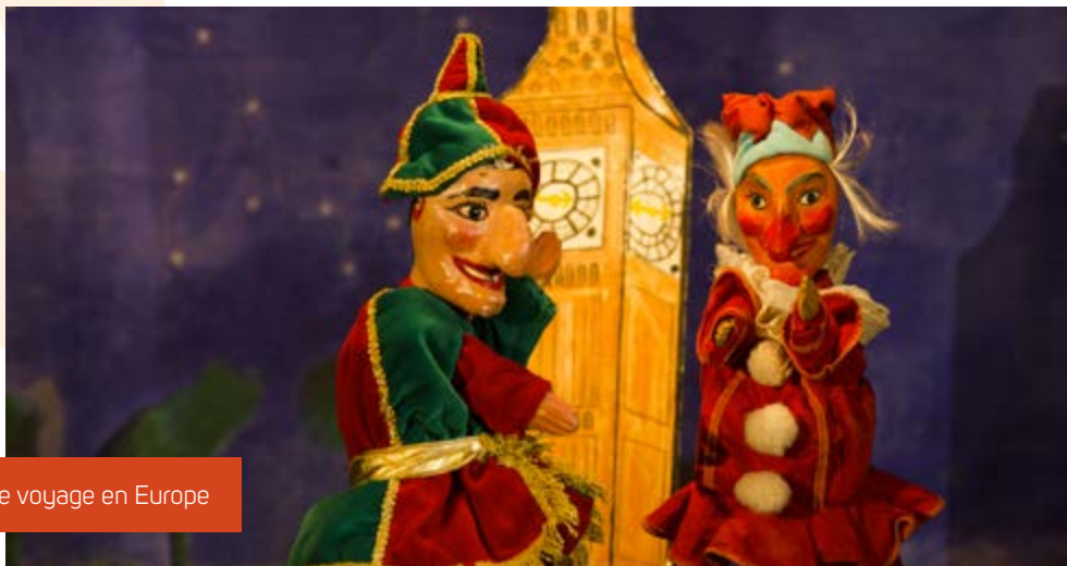
Le voyage en Europe