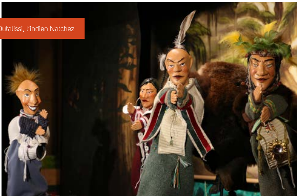
Outalissi, l'indien Natchez