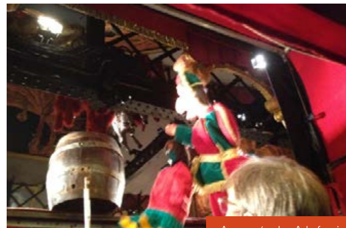
Au musée des Arts forains

Tournée dans les alliances françaises en Australie (2002) Festival de Bialystock (Pologne 2003), Festival de Gent (Belgique 2004) Représentations au Liban 2017