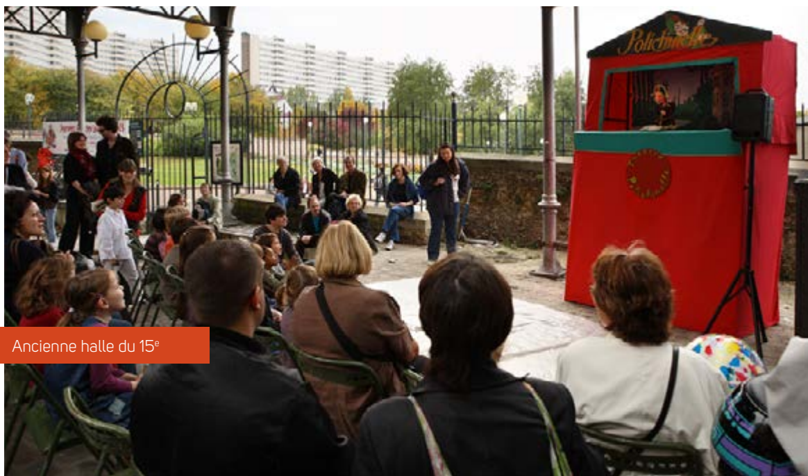
Ancienne halle du 15 e

Festival Européen de Marionnettes au Praeter à Vienne (Autriche 2005),