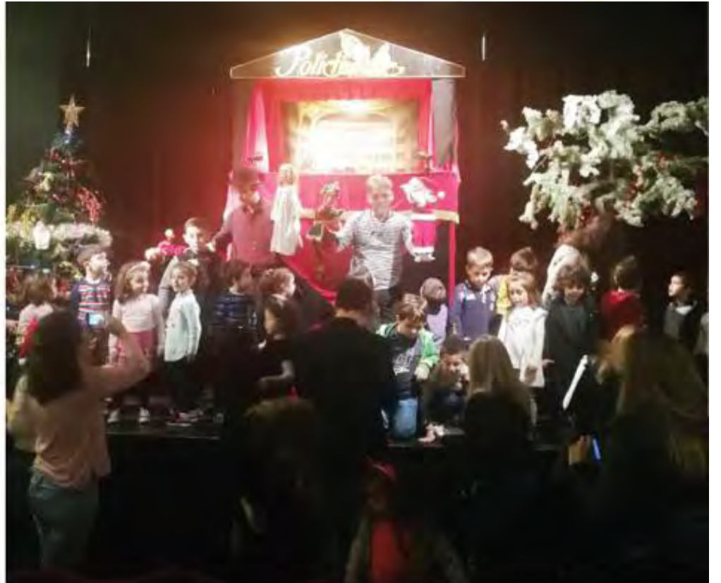
REPRÉSENTATION AU LIBAN À NOËL 2017