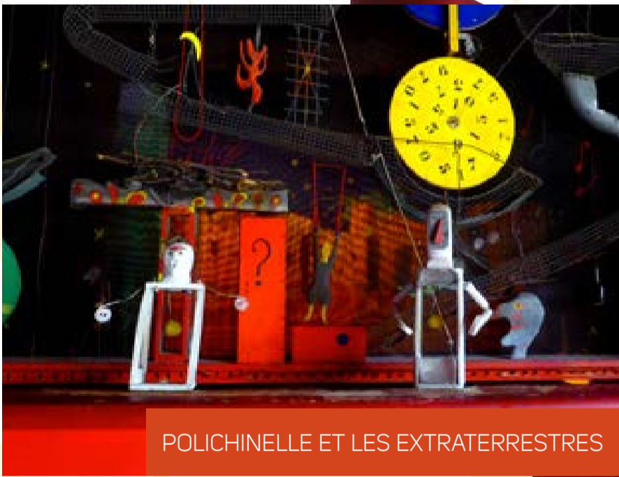
POLICHINELLE ET LES EXTRATERRESTRES