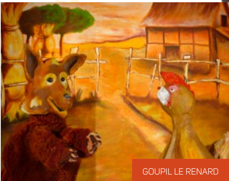
GOUPIL LE RENARD