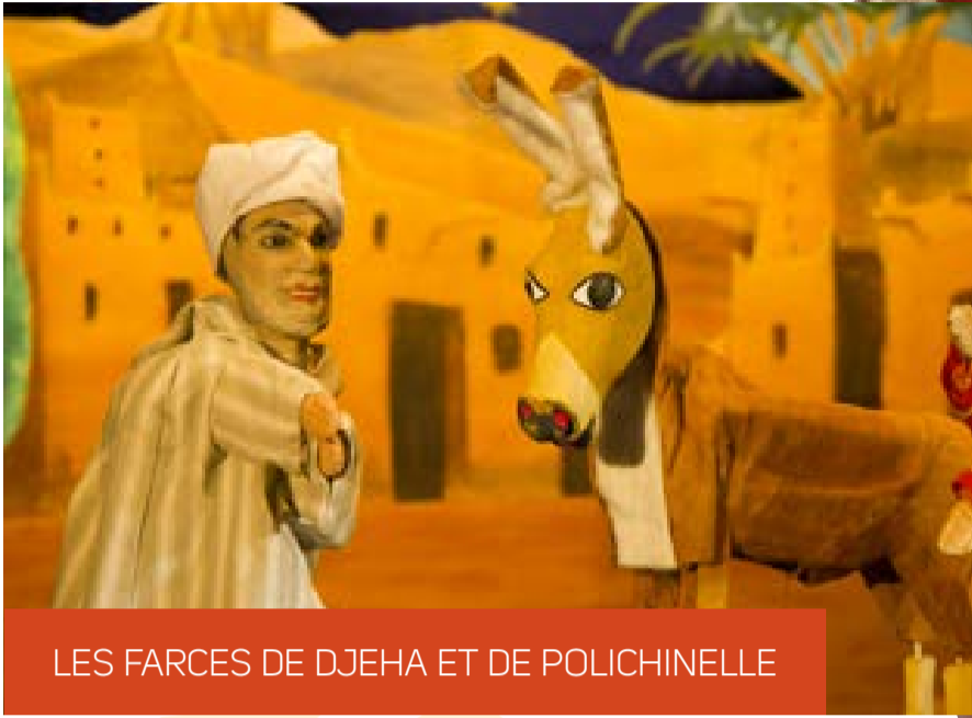
LES FARCES DE DJEHA ET DE POLICHINELLE